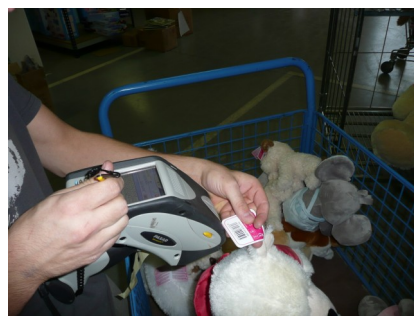
Lectors utilitzats, connectats "on-line" amb sistema ERP G2-Gest via "wi-fi"...

G2-TIRIS Solució per a la gestió i planificació de recursos empresarials (ERP)