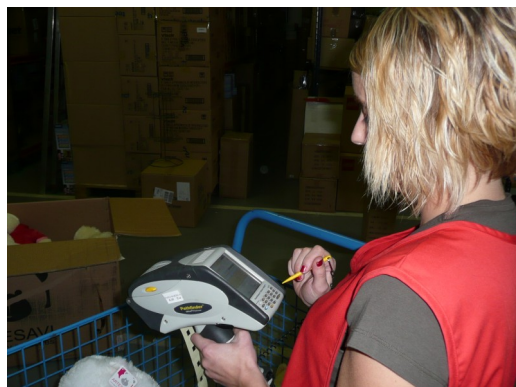
...etiquetant articles al magatzem...