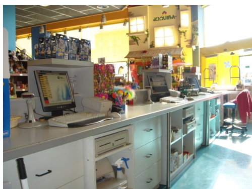
...venda al detall...