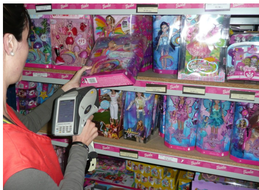
...inventariant articles al magatzem...